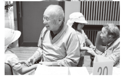
▲あじさいちゃん・酒田保育園との交流