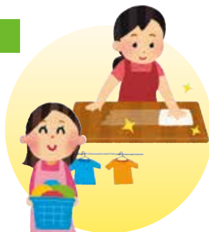
掃除・整理整頓 洗濯など